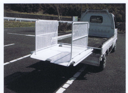
③、セフティガード開(オプション)