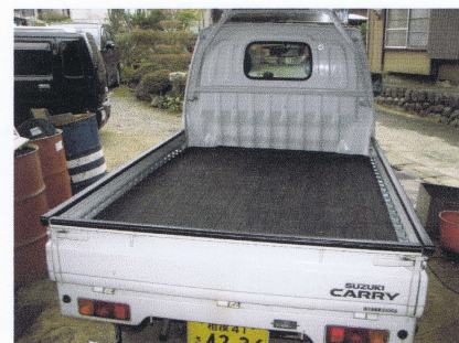
①、走行状態(リフト格納)